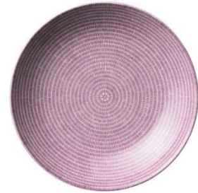
24h Avec lautanen 26cm purppura, SVH 19,40 €