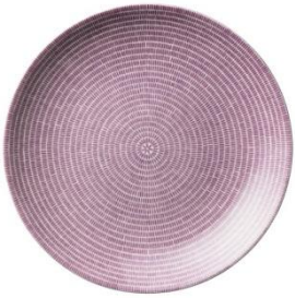
24h Avec lautanen 26cm purppura, SVH 19,40 €