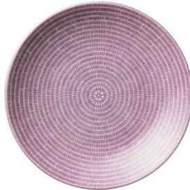
24h Avec lautanen 26cm purppura, SVH 14,60 €