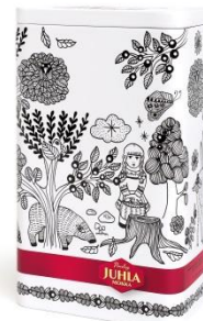
Juhla Mokka -kahvirasia

Kahvirasia sisältää 500 g Juhla Mokka -suodatinkahvia ja bambuisen kahvimitan. Rasioita on myynnissä rajoitettu erä.