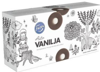
Fazer Aito Vanilja -täytekeksi

Vanilja on perinteisesti suomalaisten suosikkimaku ja nimensä mukaisesti uutuuskeksi sisältää aitoa vaniljaa. Aidon vaniljan tunnistaa täytteessä olevista tummista pisteistä. Fazer Aito Vanilja -täytekeksi tulee myyntiin toukokuussa.