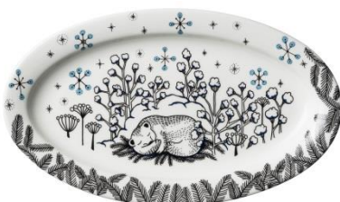
Piilopaikka tarjoiluvati 29,5 cm Pakkanen, SVH 44,00 €