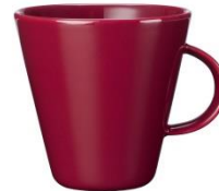
KoKo kirsikka muki 0,35 l, SVH 14,40 €

Toimitukset 1.10.2015 Saatavana rajoitetun ajan.