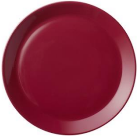
KoKo kirsikka lautanen 27cm, SVH 17,60 €