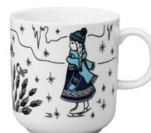
Piilopaikka muki 0,4 l Pakkanen, SVH 20,10 €