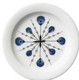
Piilopaikka lautanen 20 cm Pakkanen, SVH 25,60 €