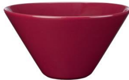
KoKo kirsikka kulho S 0,5 l, SVH 14,40 €