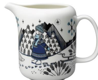
Piilopaikka kaadin 1 l Pakkanen, SVH 59,20 €