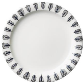
Piilopaikka lautanen 26 cm Pakkanen, SVH 28,70 €