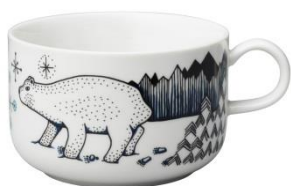
Piilopaikka kuppi 0,3 l Pakkanen, SVH 18,00 €