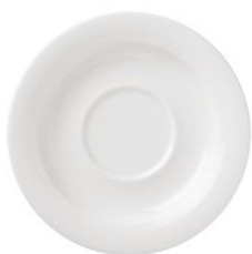
Arctica vati 17 cm, SVH 12,00 €

Toimitukset 1.10.2015 Saatavana rajoitetun ajan.