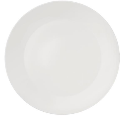
Lautanen 25 cm, 15,90 €