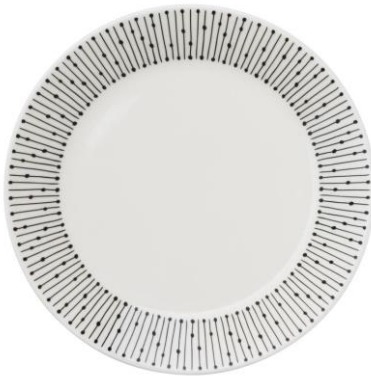
Lautanen 19 cm, 12,90 €