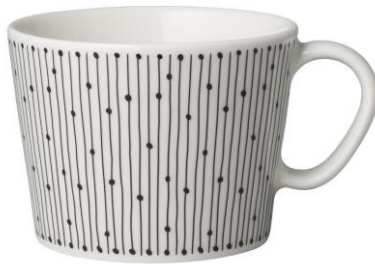
Kuppi 0,17 l, 10,90 €