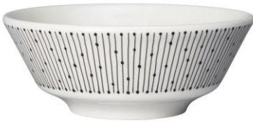
Kulho 13 cm, 12,90 €