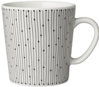
Muki 0,3 l, 13,90 €