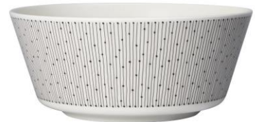
Kulho 23 cm, 39,90 €