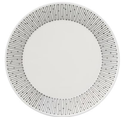
Lautanen 25 cm, 18,90 €