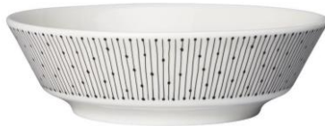
Kulho 17 cm, 18,90 €