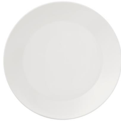
Lautanen 19 cm, 11,90 €